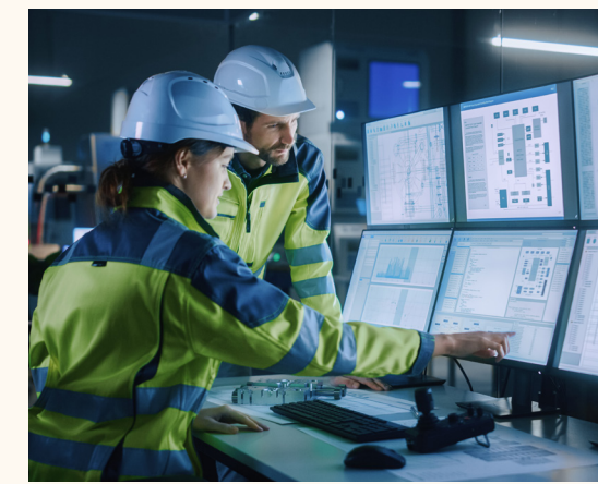
Industria de la Transformación