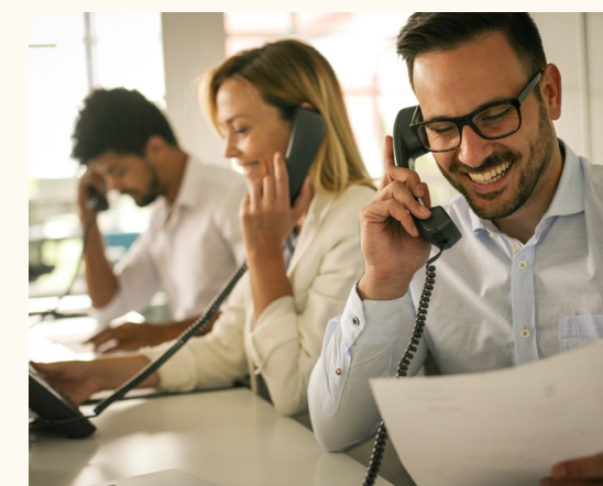
Prestadoras de Servicios